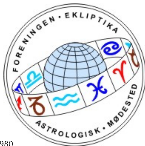
Foreningen Ekliptikas logo blev tegnet af C. Houlberg i 1980