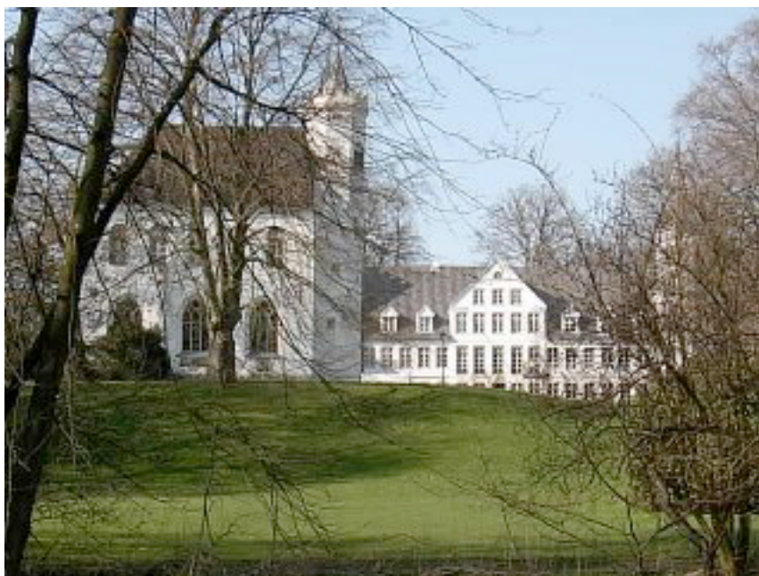
Rantzau-slægtens slot Breitenburg, som det står idag

Tractatus Astrologicus , var skrevet på latin og første udgave blev udgivet i otte bind med i alt 384 sider. Anden udgave blev samlet i fire bind og er stadig til at finde antikvarisk til omkring 20.000 kr. Det ville være fascinerende for vore dages astrologer at have en dansk eller engelsk oversættelse af dette værk.