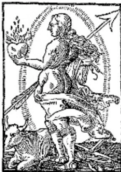
Venus (Tyr + Vægt)