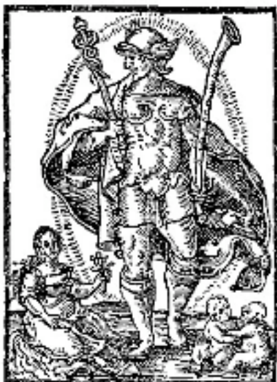
Merkur (Jomfru + Tvilling)