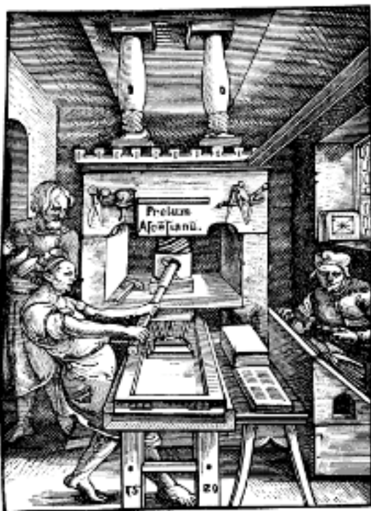
Trykkeri fra det 16. århundrede med sværteren til venstre, trykkeren i midten og bogbinderen til højre