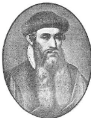
Johannes Gutenberg ca. 1400 - 1468

den første masseproducerede bog, Et enkelt eksemplar findes på Det Kgl. Bibliotek i København.