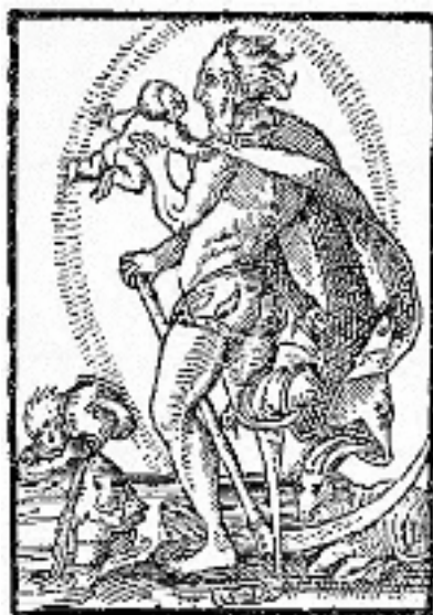
Saturn (Vandbærer + Stenbuk)

tiden ud over den høje standard han satte for bogtryk.