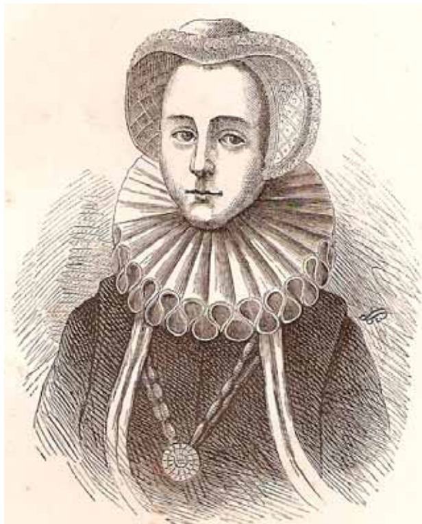
Sophie Brahe 1556-1643

Paa grundlag af disse Observationer, der blive saa