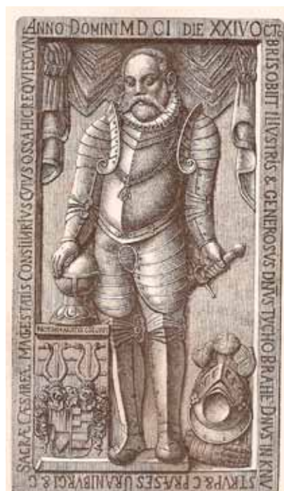
Tycho Brahes gravsten

Bekendt nok er det, at Tyge Brahes Verdenssystem, efter hvilket Jorden skulde være det faste og ubevægelige Midtpunkt for Universet, hvorom Solen og Maanen bevægede sig, medens Planeterne Merkur, Venus, Mars, Juppiter og Saturn beskrev Baner om Solen, ikke har kunnet udholde Videnskabens Kritik, og at Kepler havde Ret, naar han sluttede sig til den udødelige Astronom fra Thorn (Nicolaus Copernicus f. 19. febr.