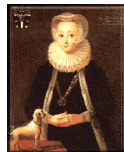
Sophie Brahe 1556-1643

Nyhedsbrevet vil udkomme når vi igen har nye interessante oplysninger, dog mindst hvert kvartal.