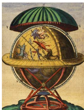
Tycho Brahes berømte Globus

Desværre er ingen af hans mange fine instrumenter bevaret til eftertiden. For eksempel gik hans berømte globus til under Københavns brand i 1728 ( sammen med Ole Rømers instrumenter ). Men Tycho Brahe beskrev sine instrumenter meget detaljeret i sin bog "Astronomiæ instauratae Mechanica" og det er via denne bog vi i dag kan få en opfattelse af de instrumenter han anvendte. Det er ikke muligt for os at udstille den originale bog, men derimod en kopi af bogen ( med oversættelse fra latin til dansk ).